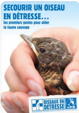
Brochure d'initiation au secourisme