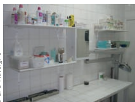
Salle de soins