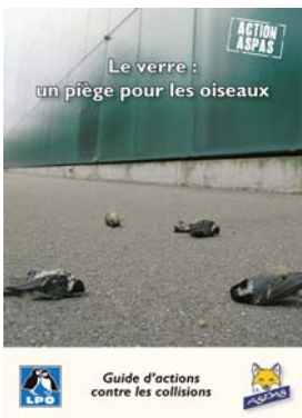
Cette brochure de sensibilisation, éditée par l'ASPAS et la LPO, est un "guide d'actions" contre les collisions avec les surfaces vitrées.