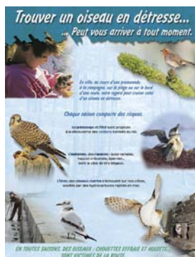
Exposition "oiseaux en soins"

Suite à la marée noire de l'Erika, la LPO a mis en place, au printemps 2000, un programme spécifique "Oiseaux en détresse", afin de venir en aide à la faune en détresse, notamment aux oiseaux, qu'ils soient mazoutés, blessés, trop jeunes ou anormalement affaiblis.