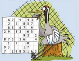
Sudogrué de L'OISEAU MAG Junior n°3

Après plusieurs jours de soins quotidiens, l'oiseau est placé à l'abri dans une volière pour refaire sa musculature. Il y passera jusqu'à plusieurs semaines... c'est parfois long. Aide donc cette grue cendrée à faire son Sudogrué !